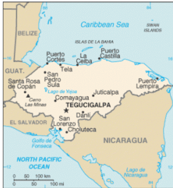
Mapa de Honduras

Ejerciendo su mandato presidencial, Manuel Zelaya aplicó una serie de medidas que alteraban las históricas relaciones supeditadas a los intereses geopolíticos y estratégicos estadounidenses y de la élite empresarial hondureña. Las siguientes son algunas medidas adoptadas en su mandato: