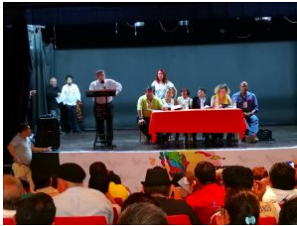
Exdiputado Bartolo Fuentes