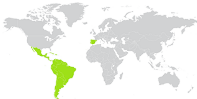
IBEROAMERICA AND THE CARIBBEAN