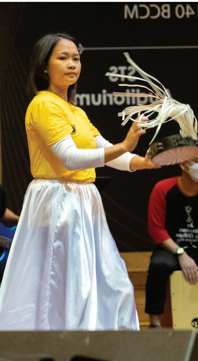
Estudiantes del Seminario Teológico Sabah, Malasia